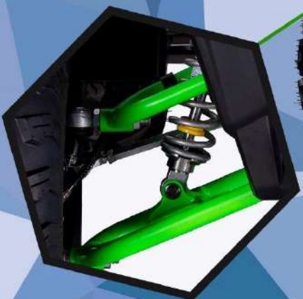
АМОРТИЗАТОРЫ С РЕГУЛИРОВКОЙ ЖЕСТКОСТИ ОБСЛУЖИВАЕМАЯ ПОДВЕСКА С ТАВОТНИЦАМИ