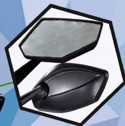
Зеркала заднего вида