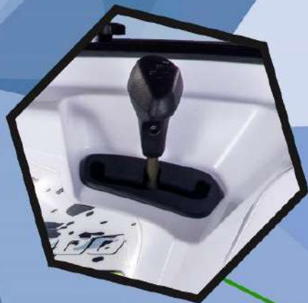
Вариатор с реверсом