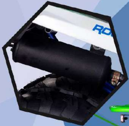
Стальная выхлопная система