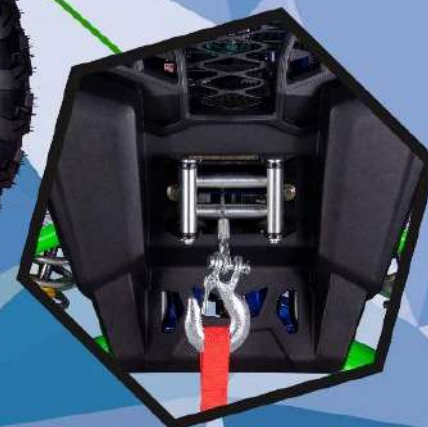
Лебедка с пультом ДУ