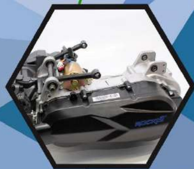
ДВИГАТЕЛЬ Одноцилиндровый, 4-х тактный с балансирным валом, объемом 200 см 3