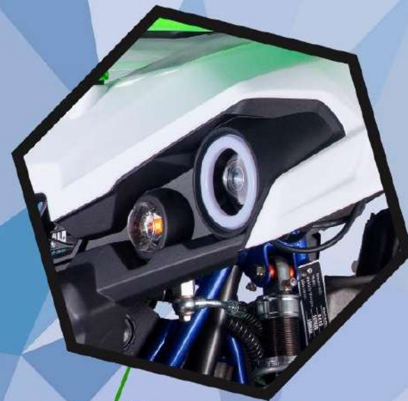
Линзованная оптика LED ходовые огни