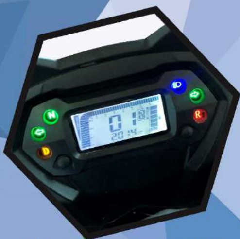
Полнофункциональная приборная LED-панель